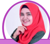
Aileena S.C.R.E.C.,S.T.,M.Ds S-1 DKV S-2 DKV