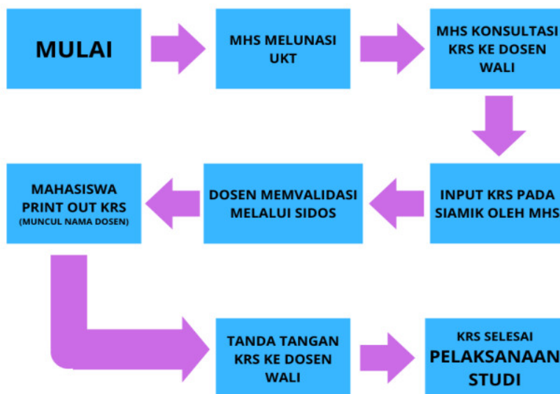
alur pengisian KRS