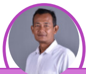
Wiyatno Pramu Ruang Baca