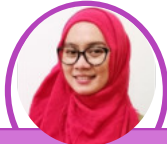
Masnuna, S.T.,M.Sn S-1 DKV S-2 DKV